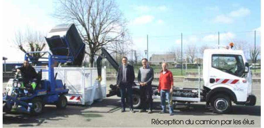
Réception du camion par les élus

Les services techniques ont été doté d'un nouveau véhicule. Ce camion polybenne améliore les conditions de travail et l'efficacité de nos employés pour l'entretien de la voirie et de nos espaces verts.